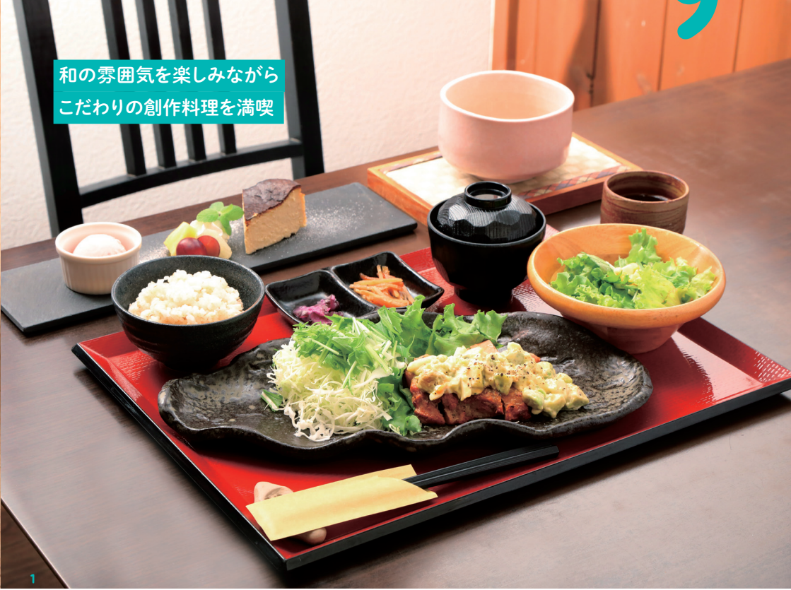
和の雰囲気を楽しみながら こだわりの創作料理を満喫