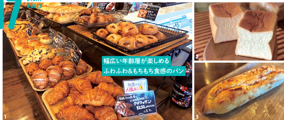
幅広い年齢層が楽しめるふわふわ&もちもち食感のパン

1. 店内のパンは全て国産小麦を100%使用しています。2. 自家製乳酸菌酵母と熟成湯だね仕込みの「もちもち食パン」1斤390円。3. 博多かねふくの明太子を贅沢に使用した「デカ明太フランス」490円。