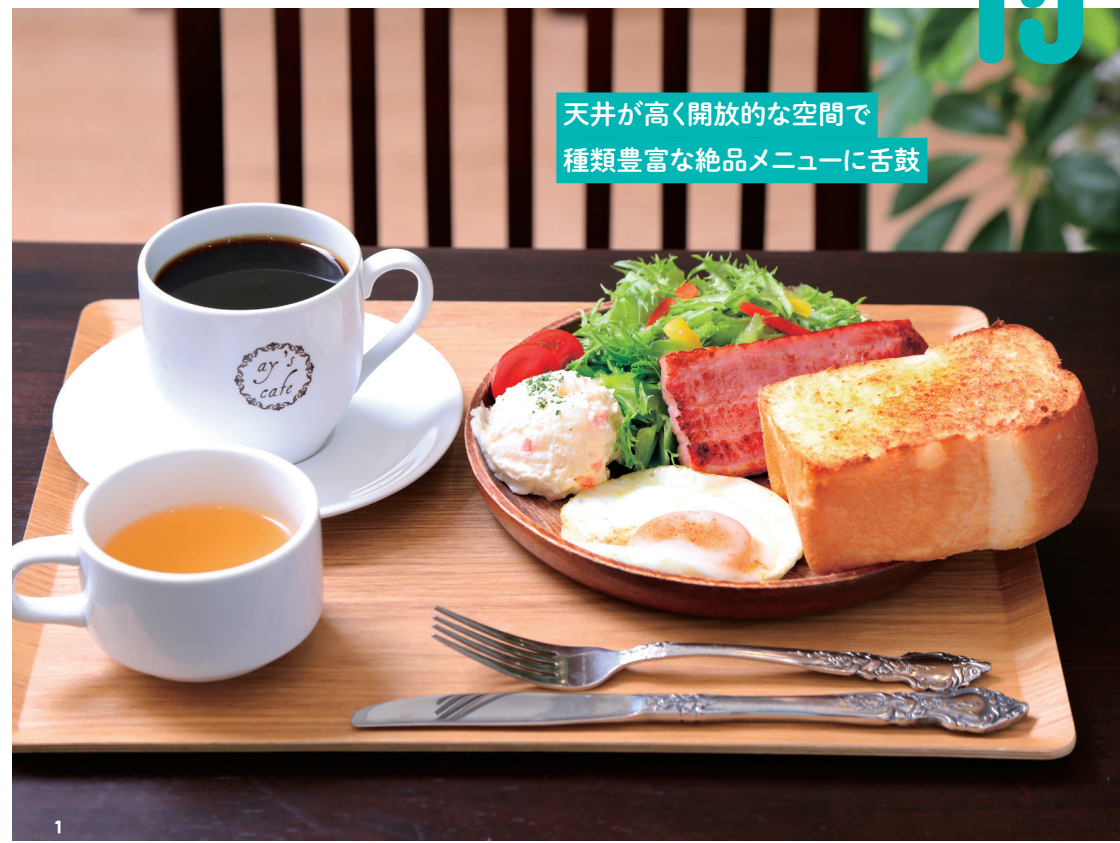
天井が高く開放的な空間で種類豊富な絶品メニューに舌鼓

10年間継ぎ足し育てた天然酵母を石窯で焼き上げるパンは、外はパリッと、中はふんわりもちもち食感が特徴。種類や具材によって小麦粉の配合や製法を変えるなど毎日食べても飽きないパンを追求。約100種類も並ぶ充実のラインナップからお気に入りのパンを選ぶのが楽しみ。