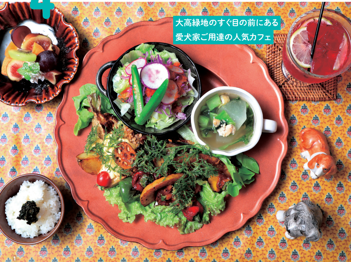
大高緑地のすぐ目の前にある 愛犬家ご用達の人気カフェ