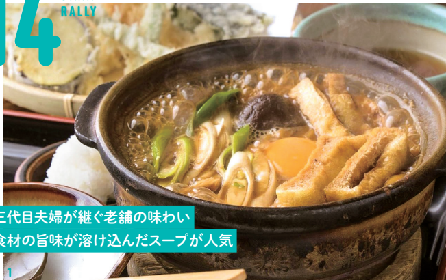
三代目夫婦が継ぐ老舗の味わい食材の旨味が溶け込んだスープが人気