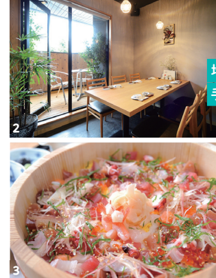
地元漁港直送の鮮魚を使った手間暇かけた魚料理が自慢

📍 uokaminagoya ☎052-879-3317 📍名古屋市緑区白土401サンシャイン白土1F 🕒 11:00~14:30、17:00~23:00 📅月曜