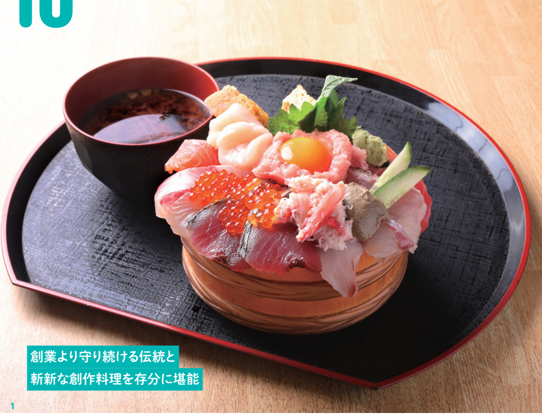
創業より守り続ける伝統と 斬新な創作料理を存分に堪能