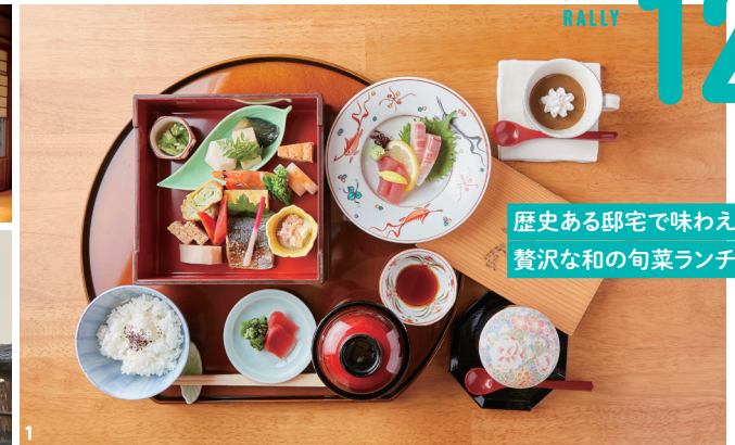
歴史ある邸宅で味わえる贅沢な和の旬菜ランチ

1. ランチ限定の旬の季節食材を楽しむ箱膳。一期一会2,500円(天ぷら付き3,000円) 2. 広々とした庭園を眺めながら、職人が腕を振るう和の真髄を堪能できます。3. レトロな町並みに佇む日本料亭。旧絞り問屋「神半邸」内にあります。