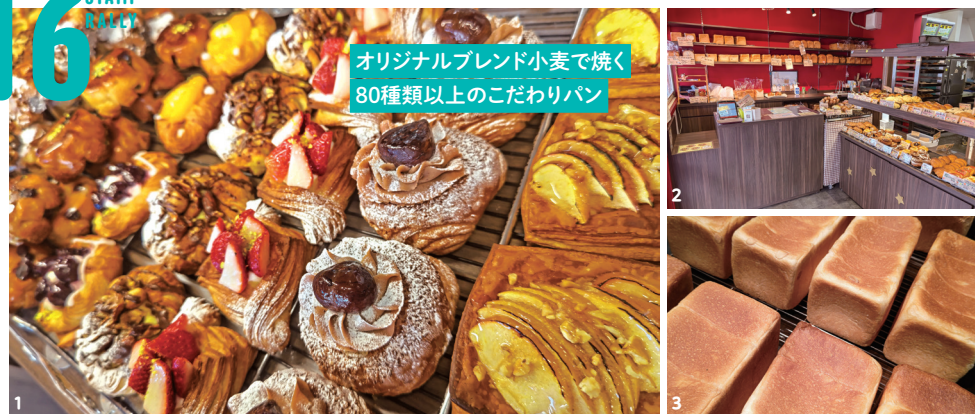
オリジナルブレンド小麦で焼く80種類以上のこだわりパン

1. 焼きたてパンが揃う開店直後や、ランチタイムに訪れるのがオススメ。2. 赤を基調とした店内。パンは食べやすいサイズ感で、たくさんの種類が楽しめます。3. 味も形も様々な食パンは9種類。一番人気は「もちもち食パン」。