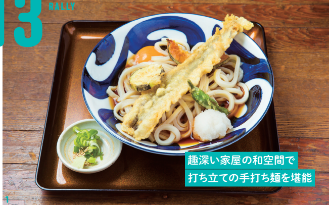
趣深い家屋の和空間で打ち立ての手打ち麺を堪能