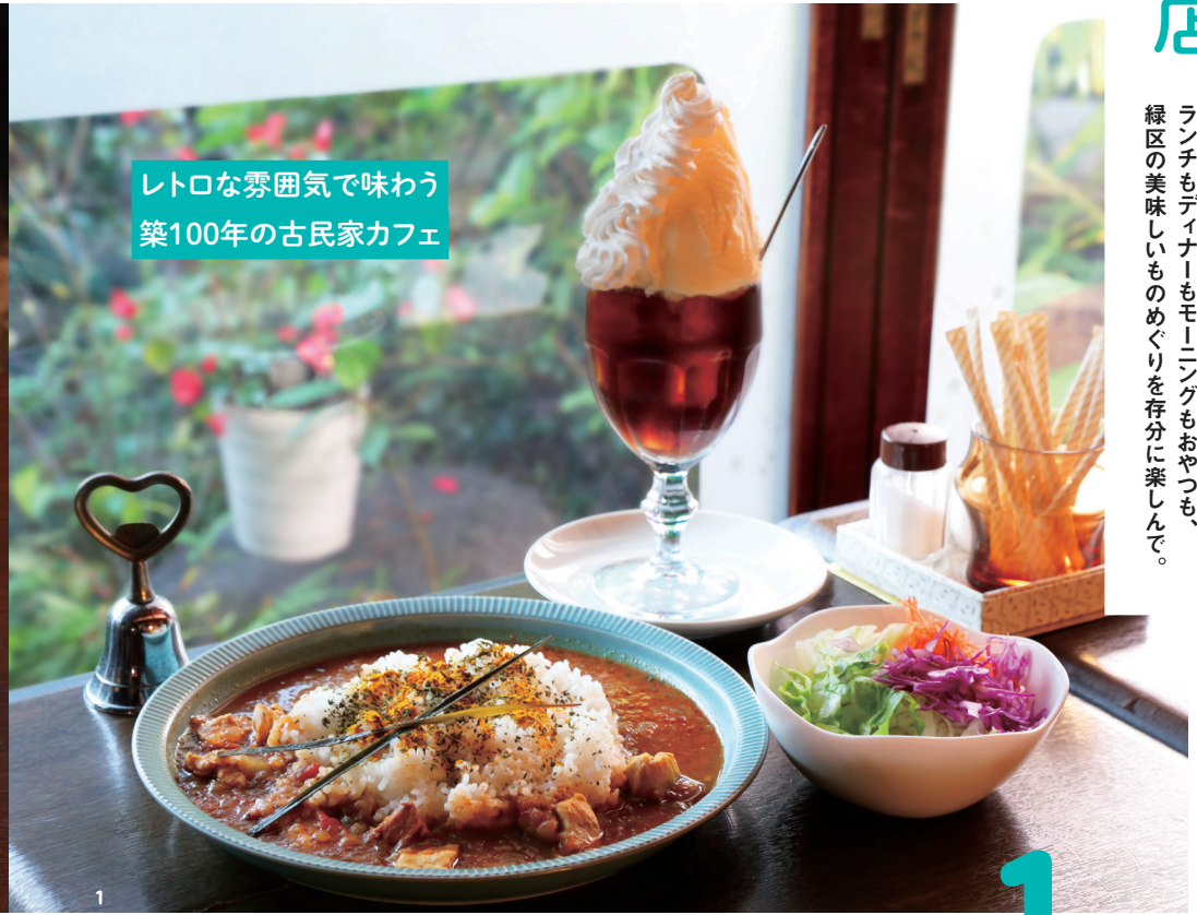
レトロな雰囲気味わう 築100年の古民家カフェ