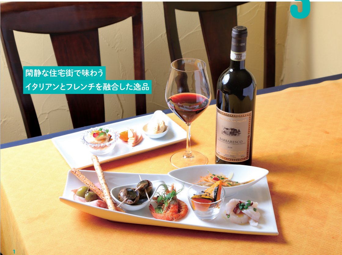
閑静な住宅街で味わう イタリアンとフレンチを融合した逸品