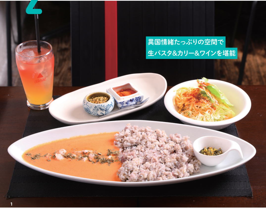
異国情緒たっぷりの空間で 生パスタ&カレー&ワインを堪能

スタンプラリーに参加する20店舗をご紹介! ランチもディナーもモーニングもおやつも、 緑区の美味しいものめぐりを存分に楽しんで。